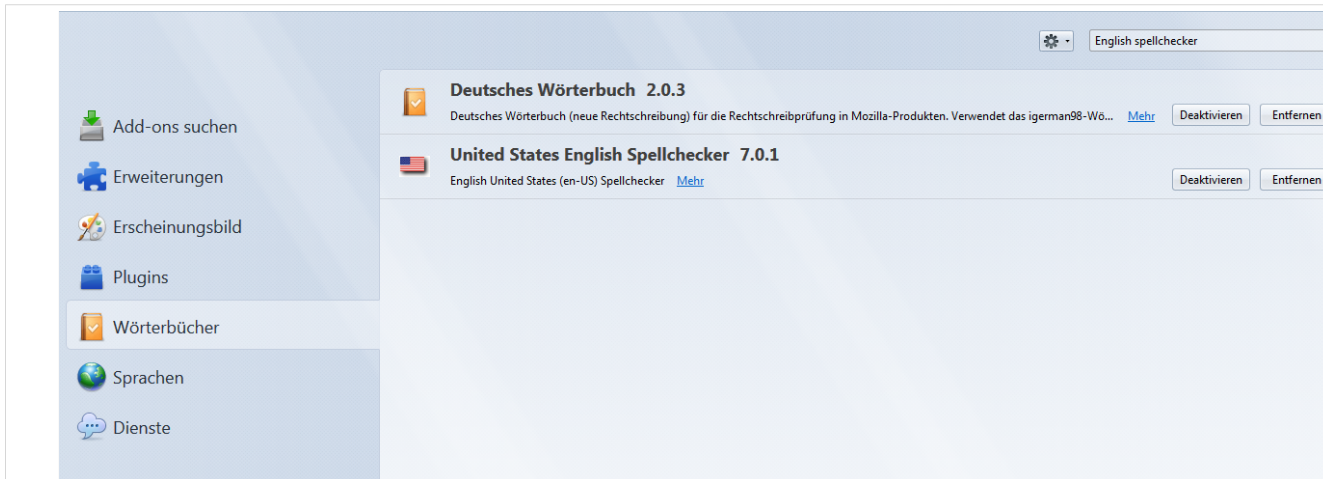
Screenshot: Suchen und aktivieren Sie die gewünschten Spellchecker/ Wörterbuch