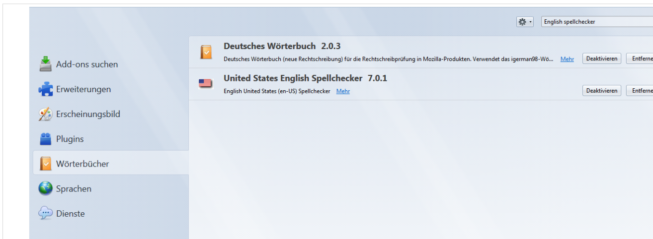
Screenshot: Suchen und aktivieren Sie die gewünschten Spellchecker/ Wörterbuch